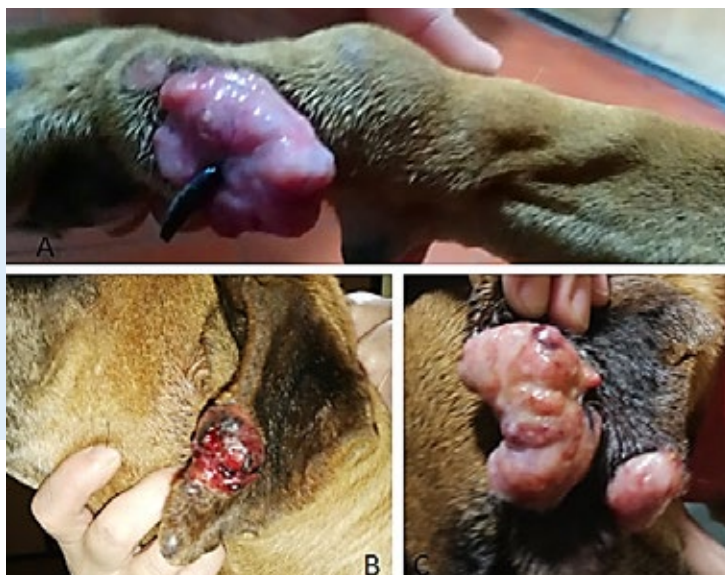
Imagen 1. (A) Lesión nodular que compromete falange proximal del primer dedo en miembro anterior derecho, la cual fue enviada para el primer estudio histopatológico. (B) Lesión tres semanas después de iniciado el tratamiento con antibiótico y previo a la toma de muestra para biopsias. (C) Lesión cuatro semanas después de haber suspendido el tratamiento antibiótico y retomado los glucocorticoides, la cual fue enviada en su totalidad para cultivo.

séricas, se realizó el procedimiento quirúrgico y se envía la masa en su totalidad para cultivo bacteriológico. El cultivo reporto Escherichia Coli sensible a ciprofloxacina, cefovecin, cefoxima y Staphylococcus Aureus sensible a oxacilina y doxiciclina.